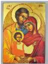
Icône byzantine de la Sainte-Famille. L'Emmanuel.

« Non, ne pas faire plus. Mais faire autrement : davantage de joie dans les petites épreuves quotidiennes. » 1191