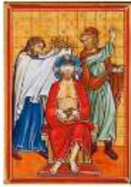
« Couronnement d'épines » Monastère de Clairval