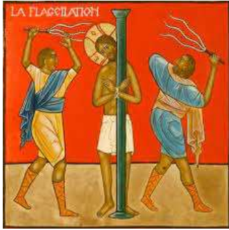
« La flagellation Rosaire »