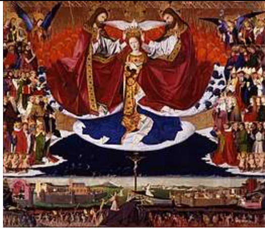
« Couronnement de la Vierge » - Enguerrand Quarton