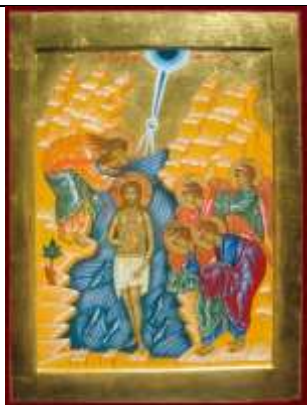
Icône du baptême du Christ- Les Recluses Missionnaires.