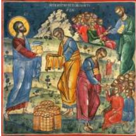
icône « Jésus rassasie les foules par amour » - Carnet d'un ermite urbain.