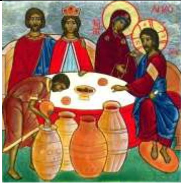
Icone « Faites tout ce qu'il vous dira »- Cahiers libres.