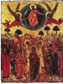
« L'ascension du Christ » - Icône Youssef Al-Musawwer - XVIIème siècle