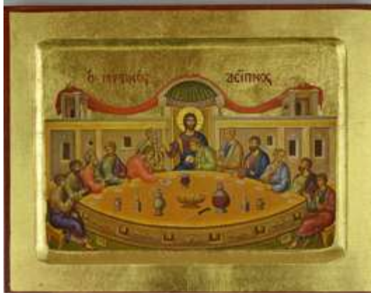
Icône byzantine la « Sainte Cène » -