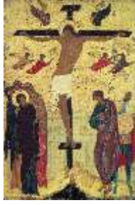
« Crucifixion » Pavlovo-Obnorski