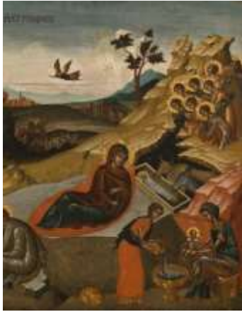
La nativité- Petit Palais