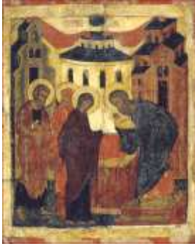
La Sainte Rencontre ou Présentation du Christ au temple- Eglise russe.