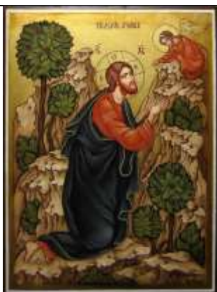
Icône orthodoxe : « L'agonie de Jésus dans le jardin »