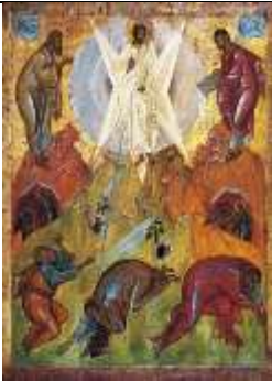
Icône de la « Transfiguration » - Andréi Roublev.

« Tu sais comme souvent dans l'Évangile il est écrit : « Votre Foi vous a sauvés. » Oh ! Mes petits enfants, croyez bien et vous Me déroberez toute grâce. » 1205