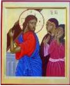
« Les filles de Jérusalem » Icône orthodoxe contemporaine