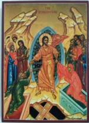
« Icône de la Résurrection » - Artastate