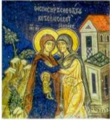
Mosaïque de la Ste Maria Gravida, Allemagne.