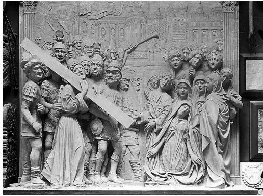
Le portement de croix. Bas-relief de l'église Saint-Didier