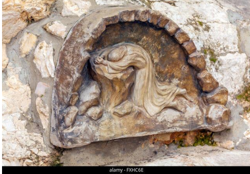
Bas-relief du jardin de Gethsémani Au Mont des oliviers.