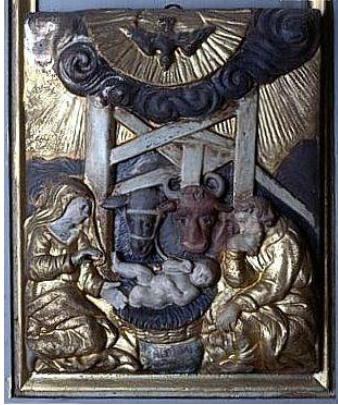
Nativité- Église de Saint-Fréjoux (Corrèze)