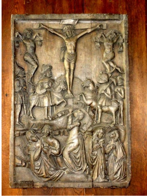
Crucifixion. Bas-relief Église Saint-Leu -Saint-Gilles

CRUCIFIEMENT Fruit du Mystère : Un amour plus grand pour Jésus, mort pour nous sauver.