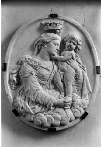
Bas-relief du couronnement de la Vierge par l'enfant Jésus Puisseux-en-Retz