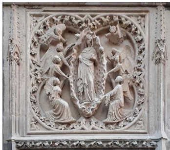
L'assomption de la Vierge. Cathédrale Notre-Dame.