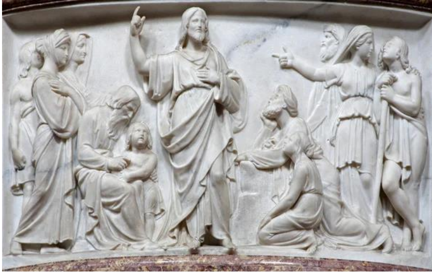
Bas-relief Prédication de Jésus Église de Bergame