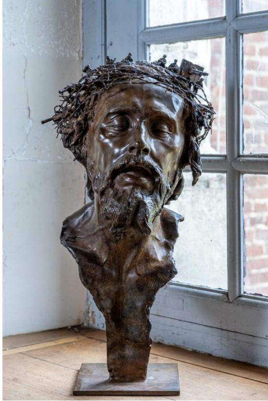
Le couronnement d'épines Sculpture de Romain de Langlois