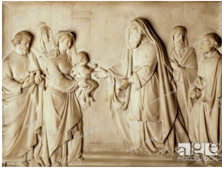
Présentation de Jésus au temple Bas-relief de l'église Saint-Charles Borroméo (Milan)