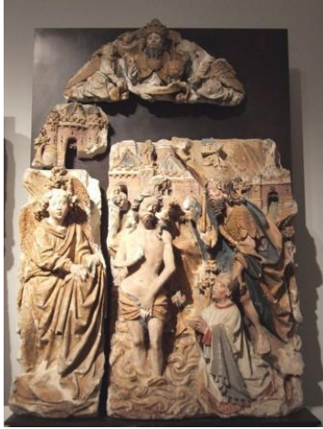
Le baptême du Christ Notre-Dame d'Amiens