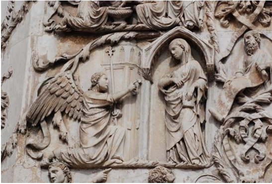
Bas-relief d'Orvieto (Italie)