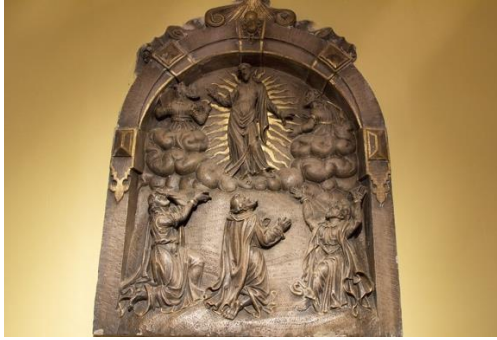
Bas-relief de la Transfiguration Église du Sacré-Cœur Edinburg.