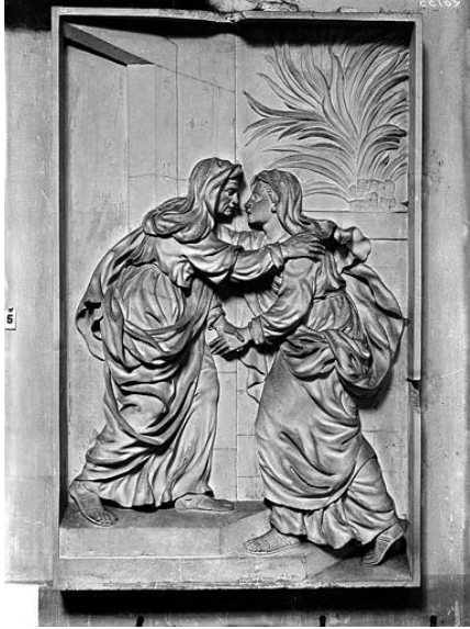
La visitation Bas-relief Chapelle de l'Assomption- Dijon