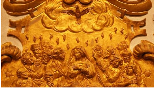
Pentecôte. Bas-relief de l'église d'Andouillé