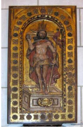
La résurrection du Christ Bas-relief de l'église Saint-Martin