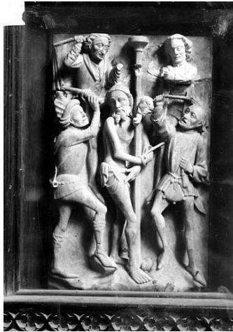
Bas-relief de la Flagellation Église de Roscoff