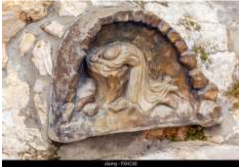
Bas-relief du jardin de Gethsémani Au Mont des Oliviers.