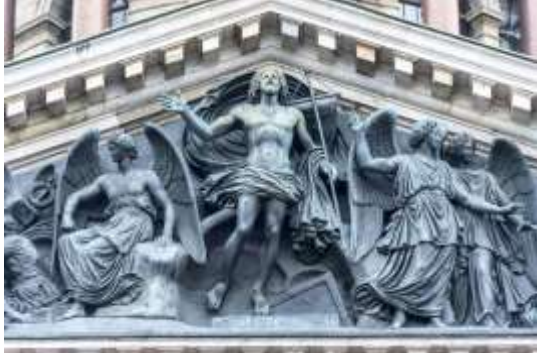
La résurrection du Christ Bas-relief de la cathédrale Saint Isaac Saint-Petersbourg