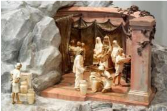
Les noces de Cana, Sculpture de Joseph Chaumet-Paray-le-Monial