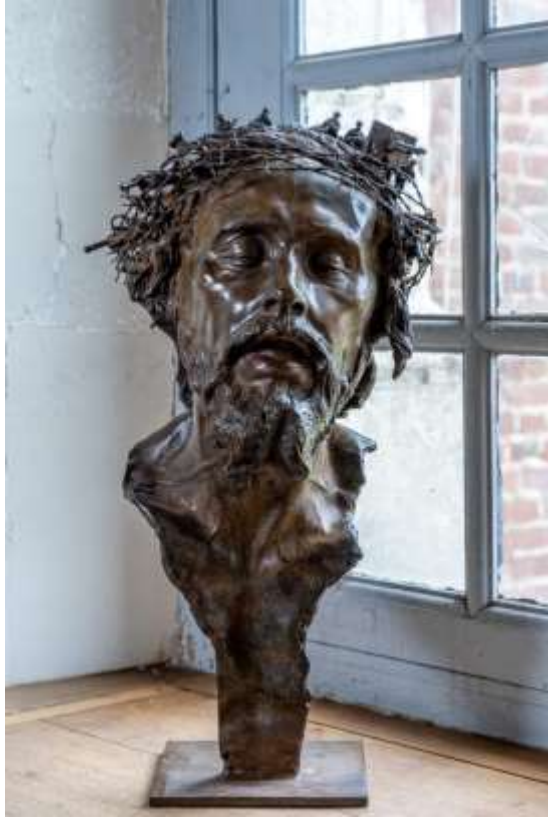
Le couronnement d'épines Sculpture de Romain de Langlois