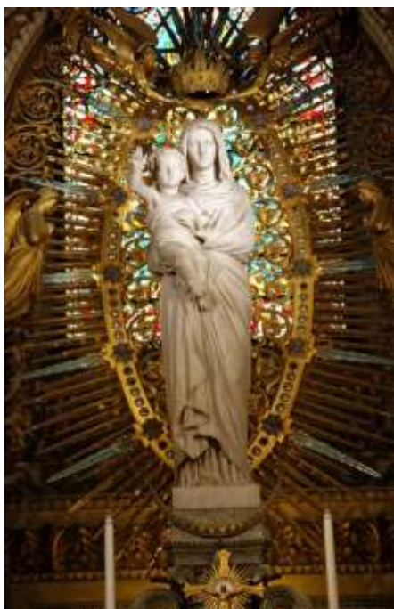
Couronnement de la Vierge- Cathédrale de Fourvière