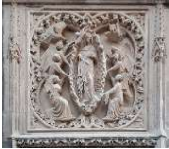
L'assomption de la Vierge. Cathédrale Notre-Dame.