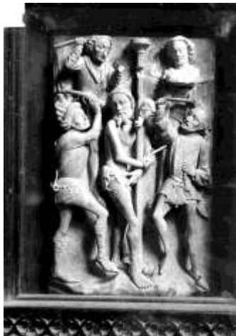
Bas-relief de la Flagellation Église de Roscoff