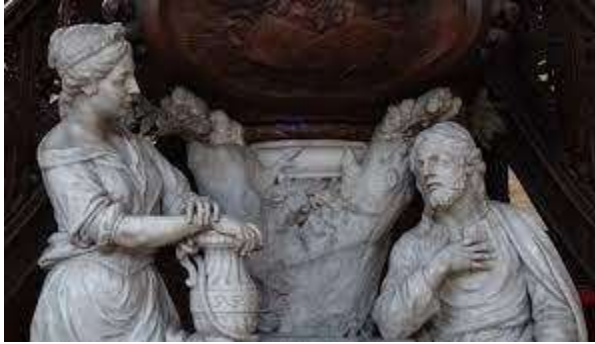
La Samaritaine Collégiale de Nivelles