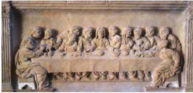
La cène. Église du confluent