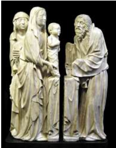
Présentation de Jésus au temple J. de Liège ou A. Beauveau – Musée de Cluny (Paris)