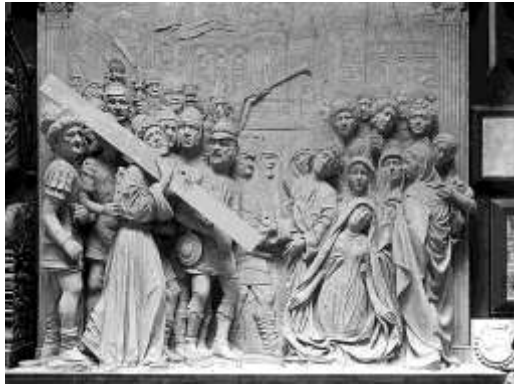
Le portement de croix. Bas-relief de l'église Saint-Didier