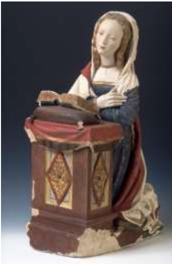
Vierge de l'annonciation- Couvent des Annonciades- Rodez