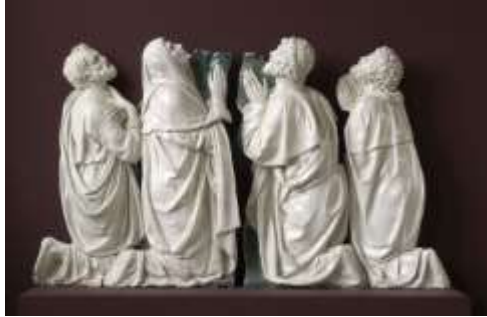
L'Ascension- Andréa della Robbia Musée du Louvre