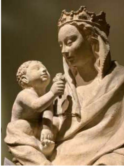
La vierge et l'enfant- Museum of Art & Gardens, Jacksonville