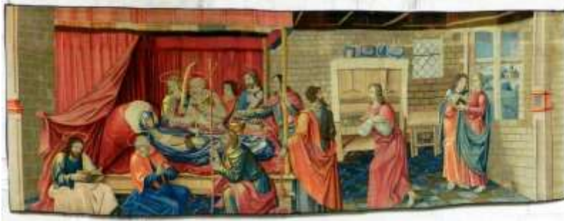
La dormition de la Vierge Marie Église Notre-Dame de Nantilly

ASSOMPTION Fruit du Mystère : la grâce d'une bonne mort.