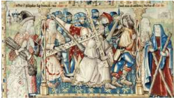
Le portement de croix. Tapisserie de la Chaise-Dieu