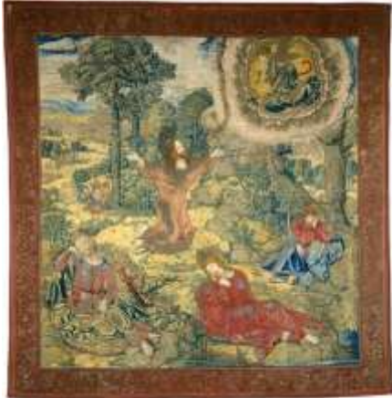
Tapisserie du Christ dans le jardin de Gethsémani Bernard von Orlay- National Galery of Art