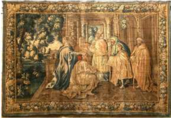
Présentation de Jésus au temple Tapisserie d'Aubusson – l'église Saint-Trophime -Arles