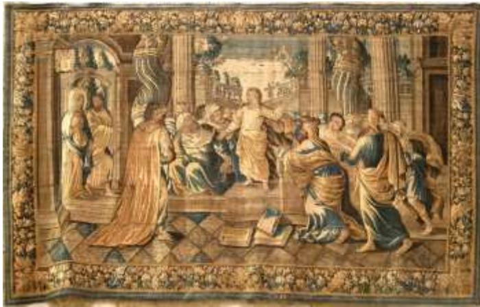
Jésus au milieu des docteurs Tapisserie d'Aubusson – Église Saint-Trophime -Arles