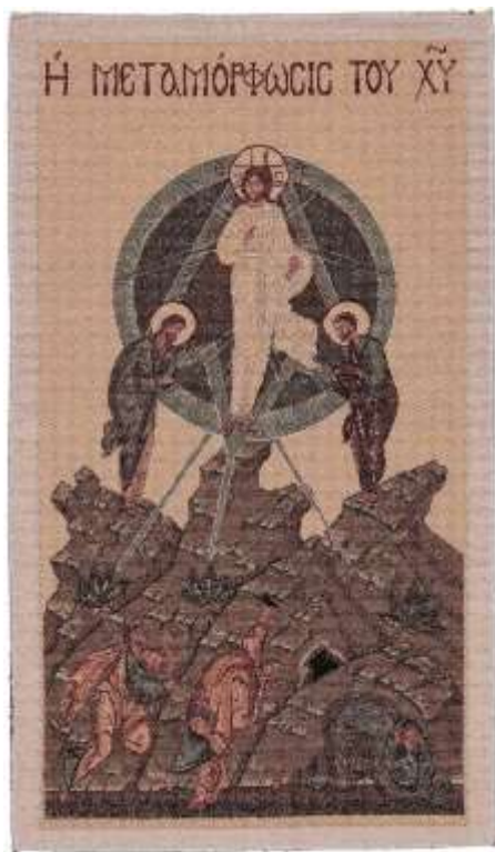
La Transfiguration Holyart tapisserie