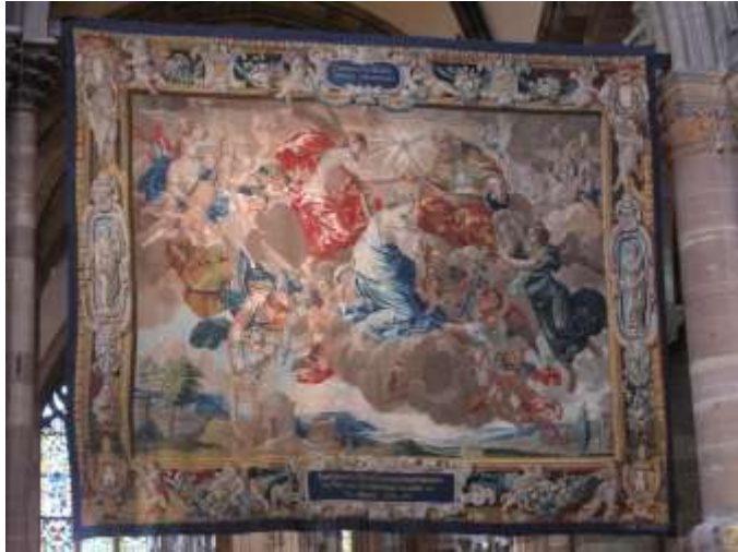
Couronnement de la Vierge- Cathédrale de Strasbourg