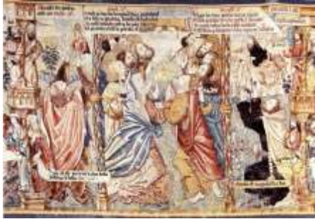
Tapiserie « L'Ascension » - Abbaye Saint-Robert de la Chaise-Dieu