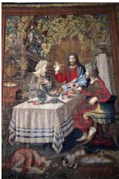
Tapiserie « Les pèlerins d'Emmaüs » Musée du Vatican