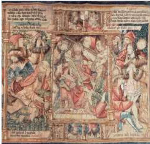
Tapiserie de la Flagellation La Chaise-Dieu