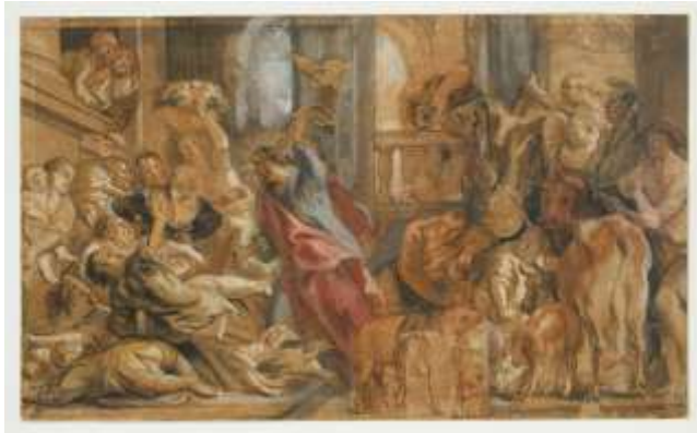
Tapissérie de « Jésus chassant les marchands du Temple » Cathédrale Saint-Vincent de Viviers (Ardèche-France)