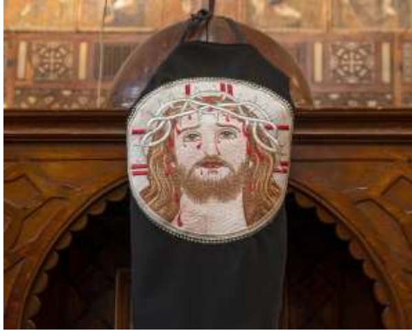
Le couronnement d'épines Photo de Pèlerin sur la Via Dolorosa