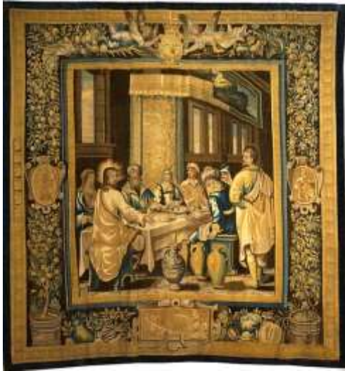
Les noces de Cana, Tapisserie du Palais du Tau (Reims)