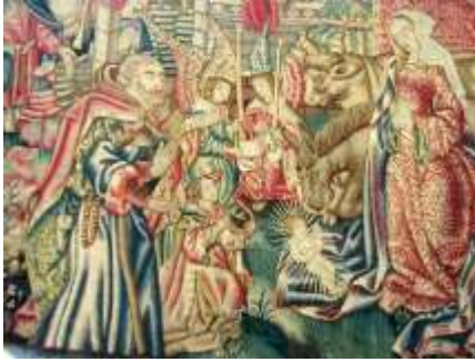
Tapissérie de la Nativité extrait d'un livre d'heures- Diocèse d'Angers