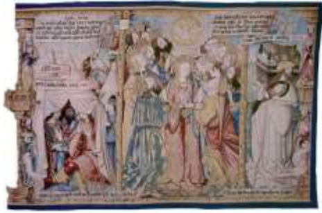
Pentecôte. Abbaye Saint-Robert de la Chaise-Dieu