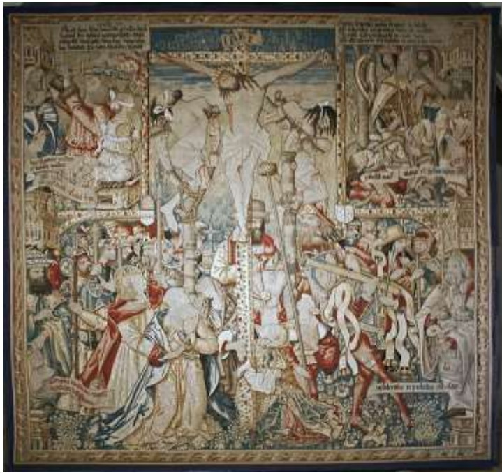
Crucifixion. Tapisserie de l'abbaye Saint-Robert de la Chaise-Dieu

CRUCIFIEMENT Fruit du Mystère : Un amour plus grand pour Jésus, mort pour nous sauver.