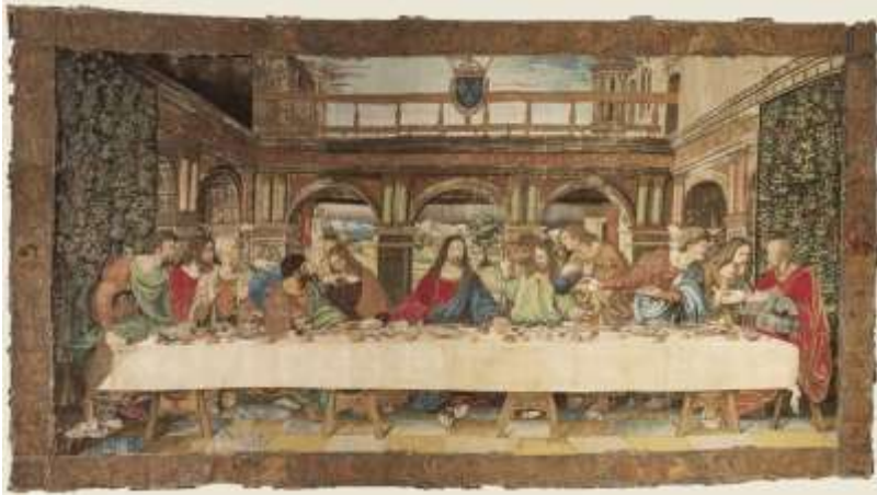
Tapissérie de Vinci « La Cène ».